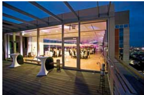
Shooting für Agentur Aktionspotenzial, Kunde PricewaterhouseCoopers, Hamburg