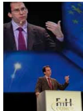
Shooting für ECI Telecom, FTTH Council Europe, Paris.