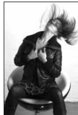
Studioarbeit für hauseigene Kampagne, Studio Köln